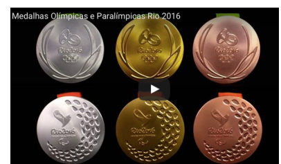
↑ 左から銀(金より良い)、金、銅(金と同じ)