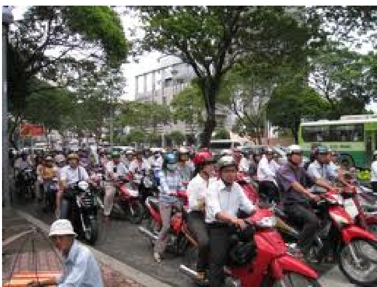
バイクの群れ、横断歩道渡るのは至難の業 (Ho Chi Minh市内)

今の我が国の様に寿命が長ければhappyかという、決して素直に受け入れ難いものがあり、日本の100歳を超える超高齢者生存の行方が可成りあやふやであること、胃瘻や腸瘻、中心静脈栄養などのルート作成によりベッド上臥床のまま延命なさっておられる高齢患者さん方を診るにつけ、家庭によっては様々な事情はあるにせよ、国全体が小児臓器移植のように、そろそろ「生きるということ」についても正面から向き合っ社会全体の仕組みをシッカリ考え直すべき時期に来ている様に思われました。当院赴任3年目の夏にシッカリと充電させて戴いたので、また今日から暑くても気持ちをシャンと引き締めて頑張りたいと思います。